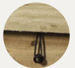
Kit fermeture couvercle