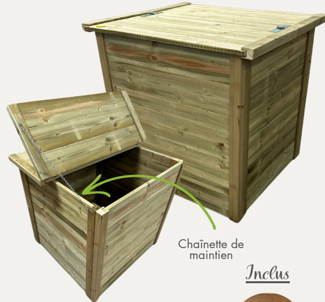
Chaînette de maintien

Un espace de 2 mm entre chaque planche favorise l'aération nécessaire à la fermentation aérobie. Ses cloisons robustes et ses panneaux renforcés assurent sa durabilité et son étanchéité.